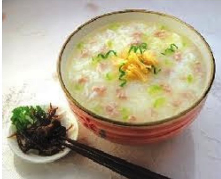
Congee servito al Mandarin di Hong Kong