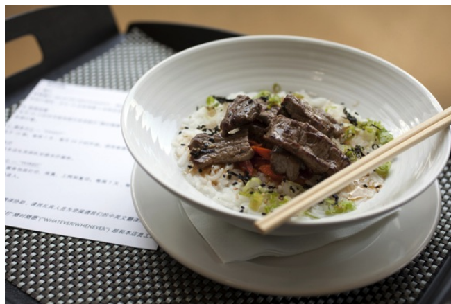
Congee come lo serve Starwood

Tutto questo (non ha costi rilevanti) è già disponibile negli alberghi Hilton e Starwood nelle città cinesi. Un portavoce di Starwood anticipa il seguente scenario: con 100 milioni di viaggiatori attesi nel 2015 vorremmo essere “attraenti” e nutrire piacevolmente questo mercato facendolo sentire benvenuto sia in Cina che nelle altre nazioni del mondo dove ci sono nostri alberghi.