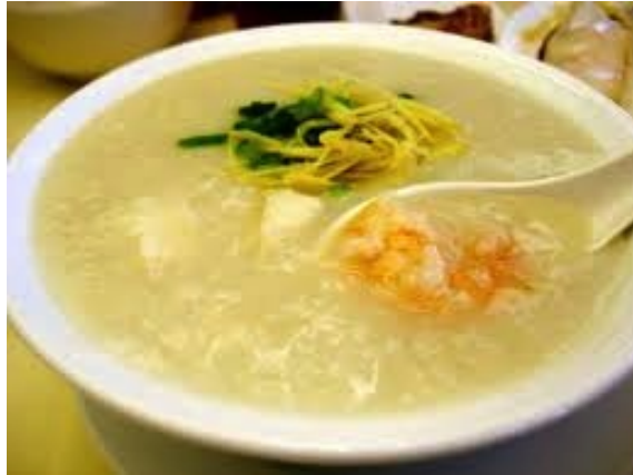
Questo Congee è una versione "de luxe" con crostacei sgucciati