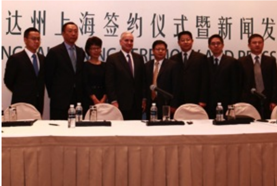
Management Radisson-Cina: un solo occidentale tra 7 manager cinesi

La Cina riesce a costruire grattacieli incredibili, opifici industriali e decine di alberghi in tempi ristretti. E' un paradiso per i designer e per il know-how alberghiero americano.