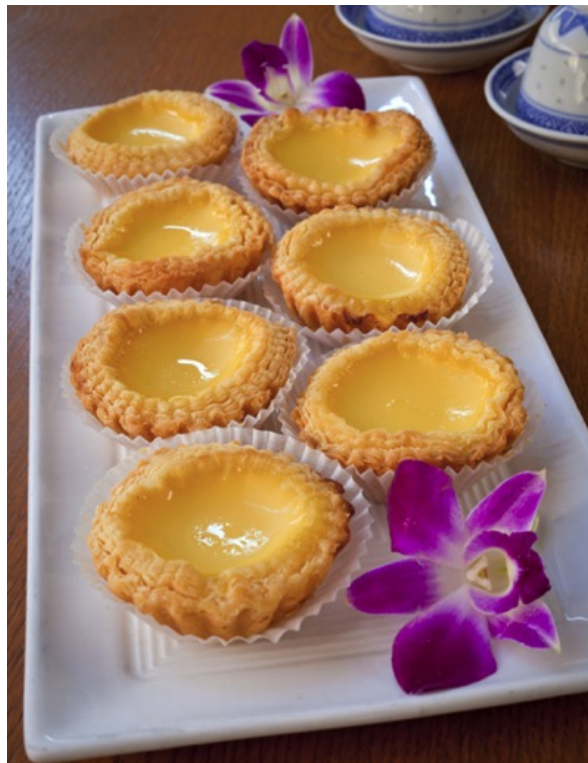
Dolci dessert cinesi serviti dal Hilton Huanying.