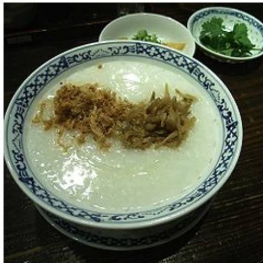
Congee come lo servono a Seoul (Korea)