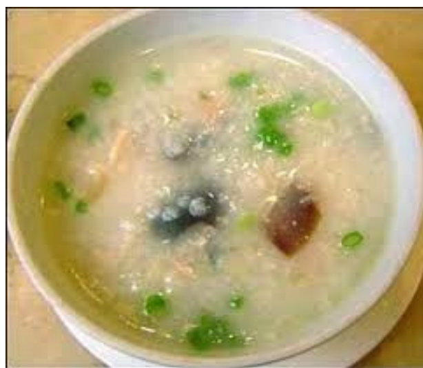
Congee disponibile a Macao