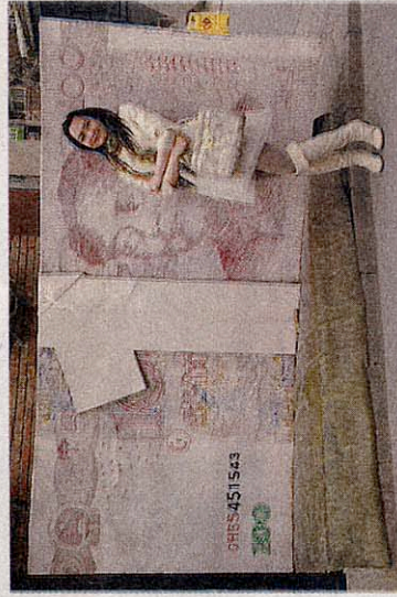
I cinesi ormai non li ferma più nessuno

ai giocattoli, all'oggettistica e alla conduzione di pubblici esercizi". Per la Cgia, ormai il 70% del totale delle imprese presenti nel nostro Paese si concentra nei servizi: settore che consente, a differenza del manifatturiero, un grande riflusso di capitali verso la Cina. "Si pensi che l'anno scorso, a fronte di 7,4 miliardi di euro che gli immigrati residenti in Italia hanno inviato nei Paesi di origine - continua Bortolussi - 2,5 miliardi, pari al 33,8% del totale, sono stati spediti dalla comunità cinese". Nonostante questi aspetti positivi non mancano però i problemi. "Innanzitutto - prosegue Bortolussi - è una comunità poco integrata con la nostra società, perché la quasi totalità di questi lavoratori non parla la nostra lingua. Inoltre, buona parte di queste attività, soprattutto nel manifatturiero, si sono affermate eludendo gli obblighi fiscali e contributivi, aggirando le norme in materia di sicurezza nei luoghi di lavoro e non rispettando i più elementari diritti dei lavoratori. Tuttavia è giusto sottolineare - conclude Bortolussi - che anche gli imprenditori italiani non sono immuni da responsabilità. In molte circostanze, co-