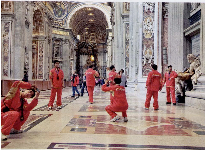
A ROMA, IN POSA TRA LE NAVATE DI SAN PIETRO